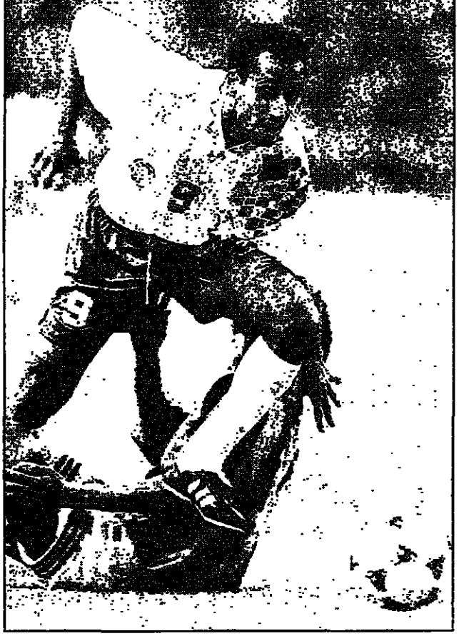
اللاعب السعودي سامي الجابر